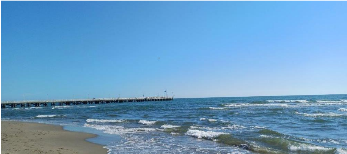
Toscana - Italien