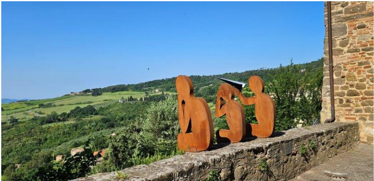
Toscana - Italien